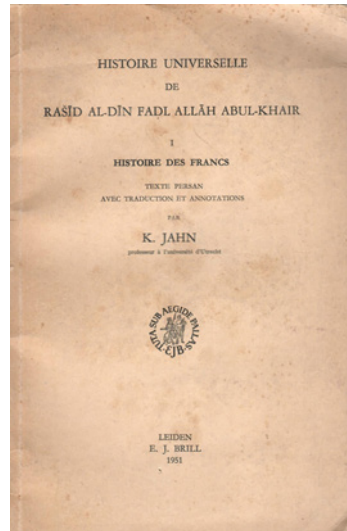
Copertina del libro originale